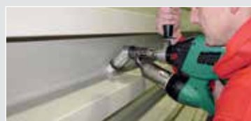
使用WELDPLAST S2配合弯角接头对塑料制品的细部进行焊接。(附件)