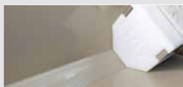
WELDPLAST S2 实现完美焊接，焊缝精良。