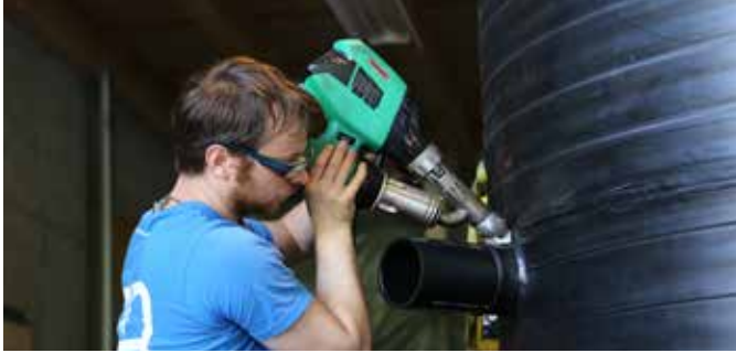
操作方便的 WELDPLAST S2 进行焊接。